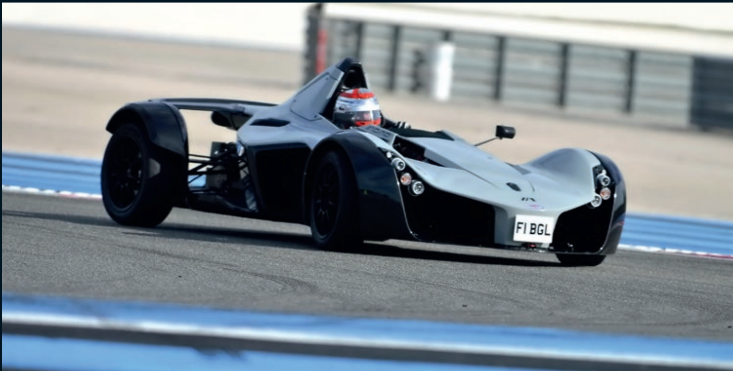
BAC MONO 2016