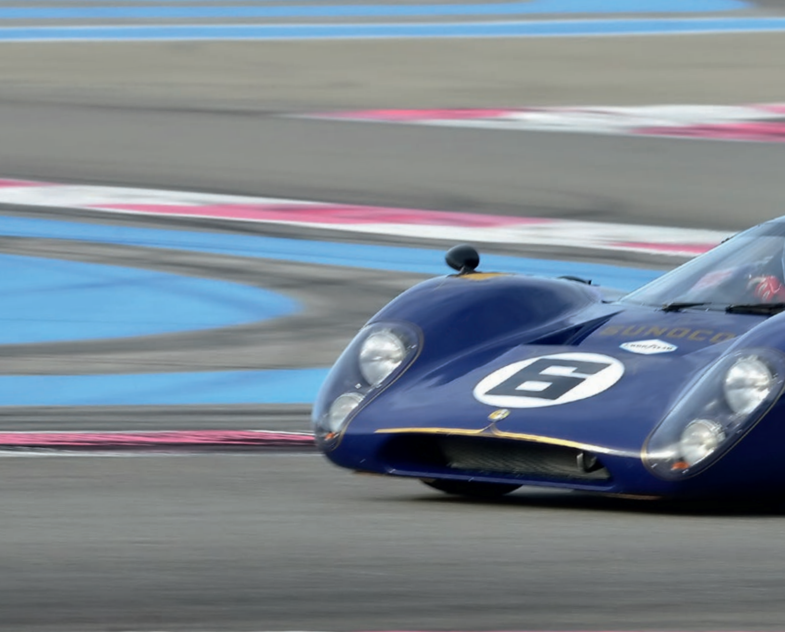
LOLA T70 1968