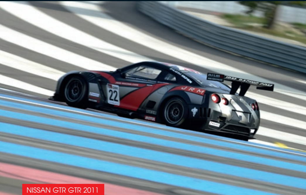
NISSAN GTR GT3 2011