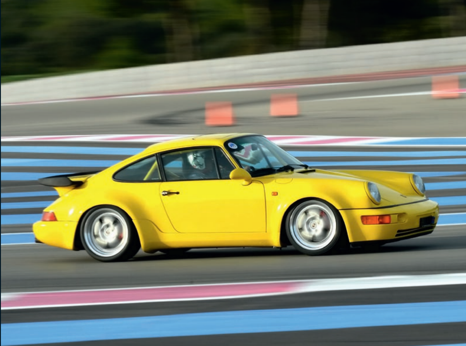
PORSCHE 964 TURBO 1992