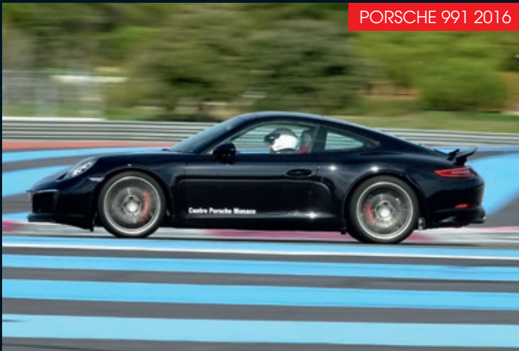
PORSCHE 991 2016