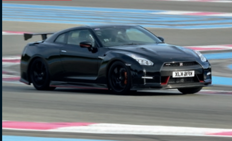
NISSAN GTR 2015