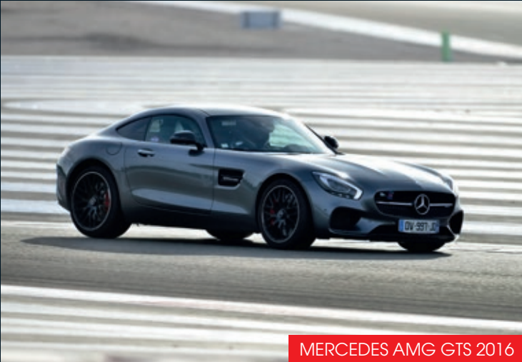
MERCEDES AMG GTS 2016