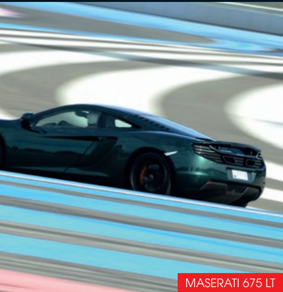
MASERATI 675 LT