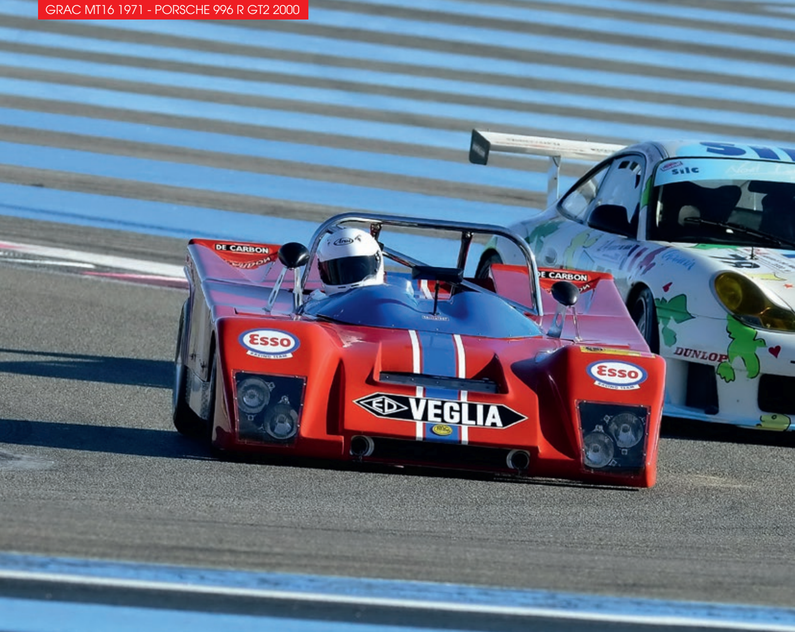
GRAC MT16 1971 - PORSCHE 996 R GT2 2000