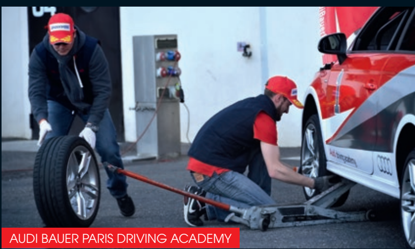
AUDI BAUER PARIS DRIVING ACADEMY