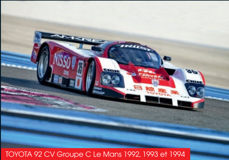
TOYOTA 92 CV Groupe C Le Mans 1992, 1993 et 1994