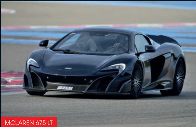
MCLAREN 675 LT