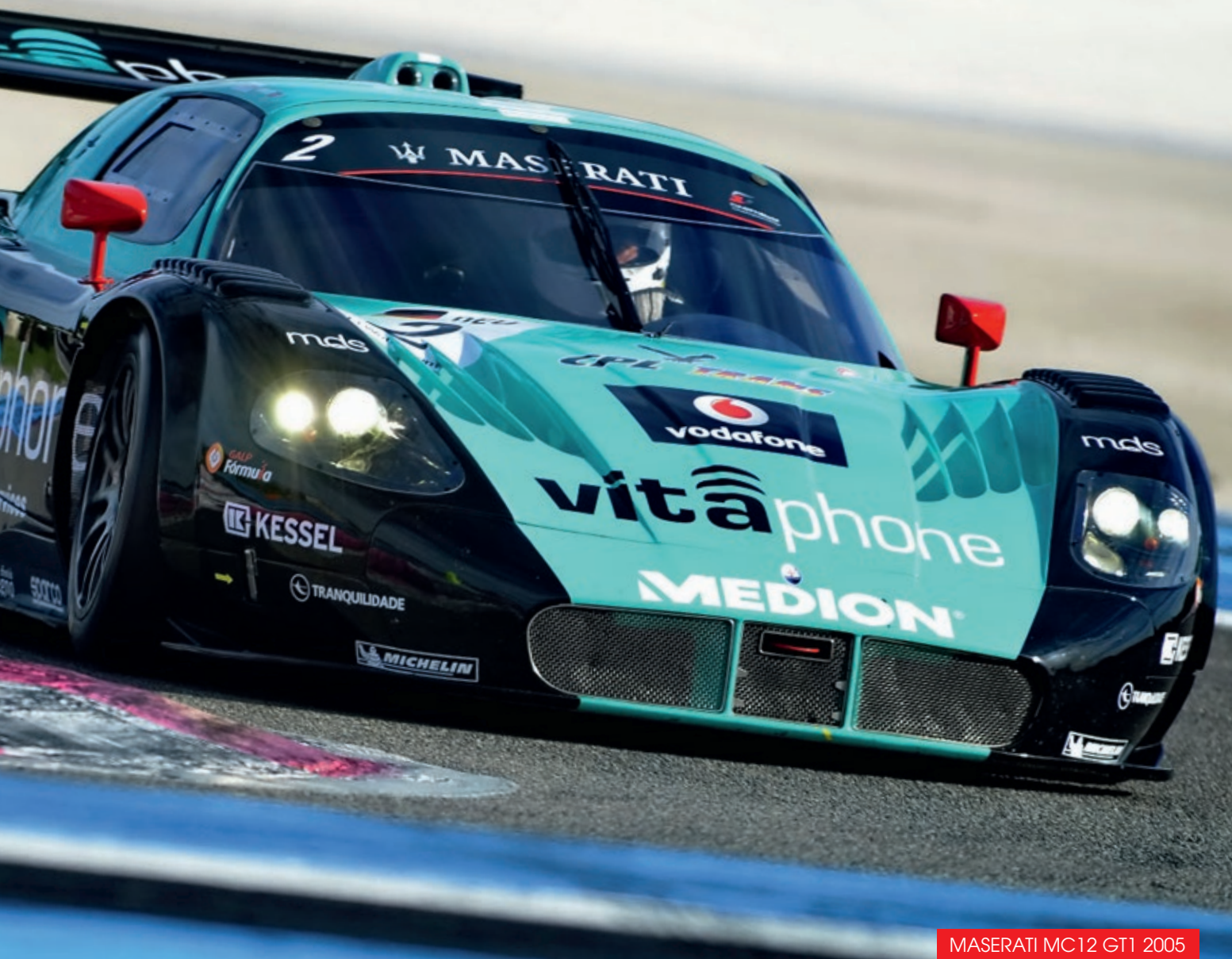
MASERATI MC12 GT1 2005