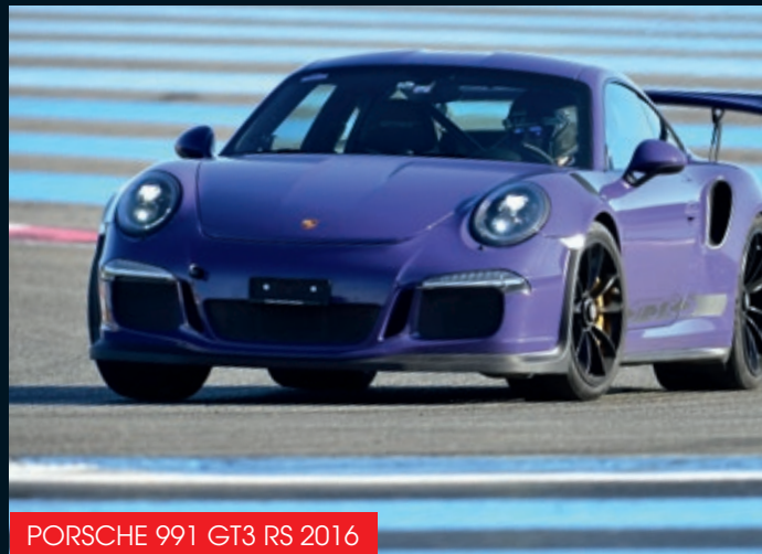
PORSCHE 991 GT3 RS 2016