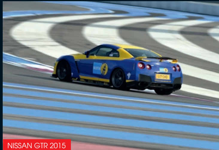
NISSAN GTR 2015