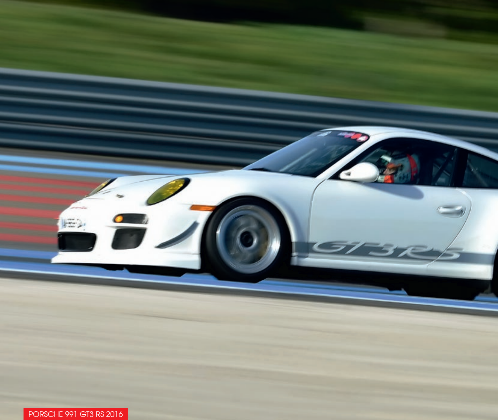
PORSCHE 991 GT3 RS 2016