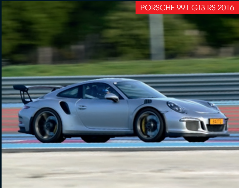
PORSCHE 991 GT3 RS 2016