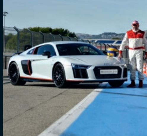
AUDI R8 2016