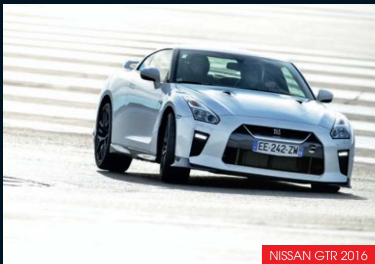
NISSAN GTR 2016